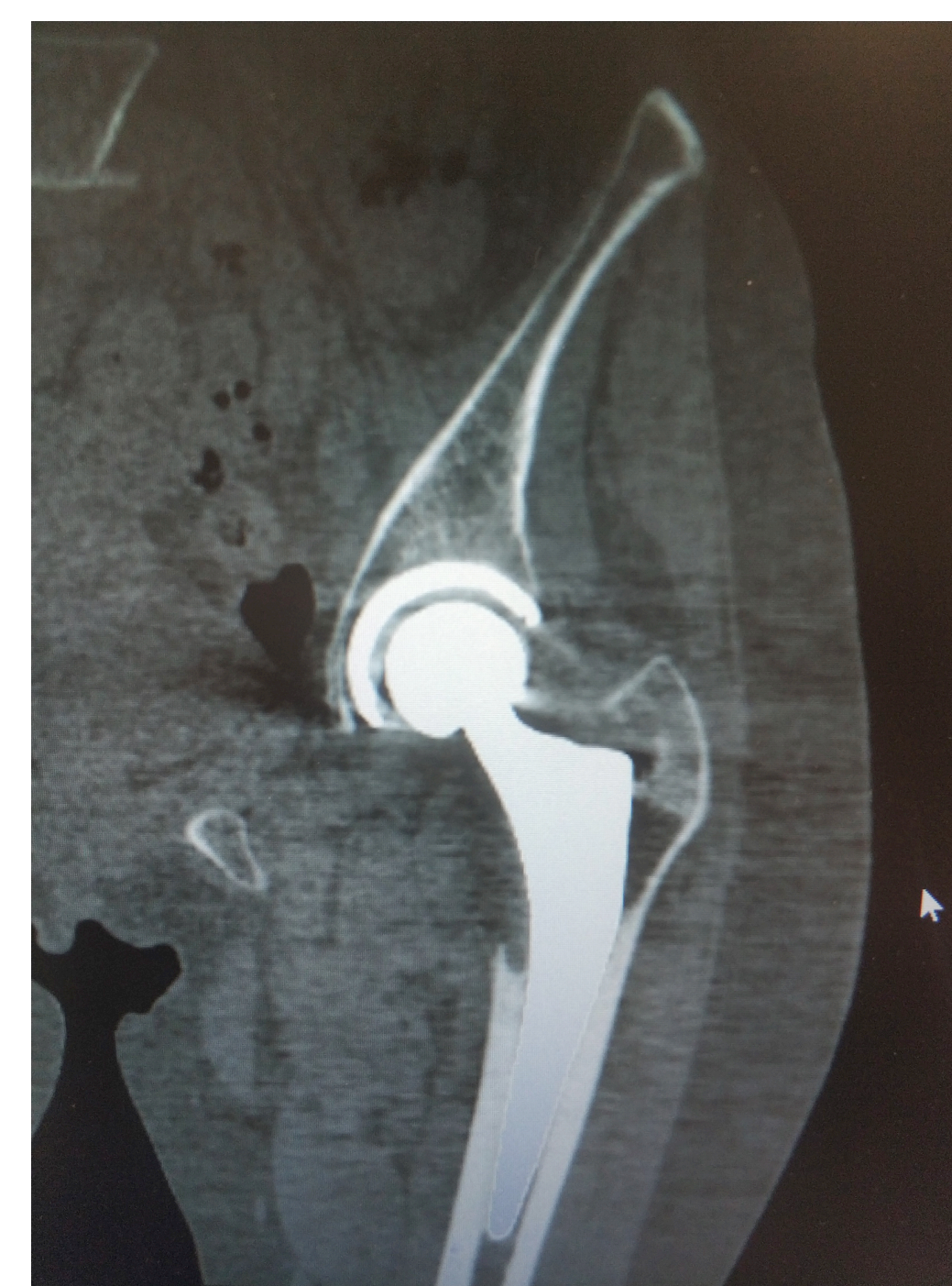
Fig 3. TAC con Osteolisis en zona trocantérica izquierda