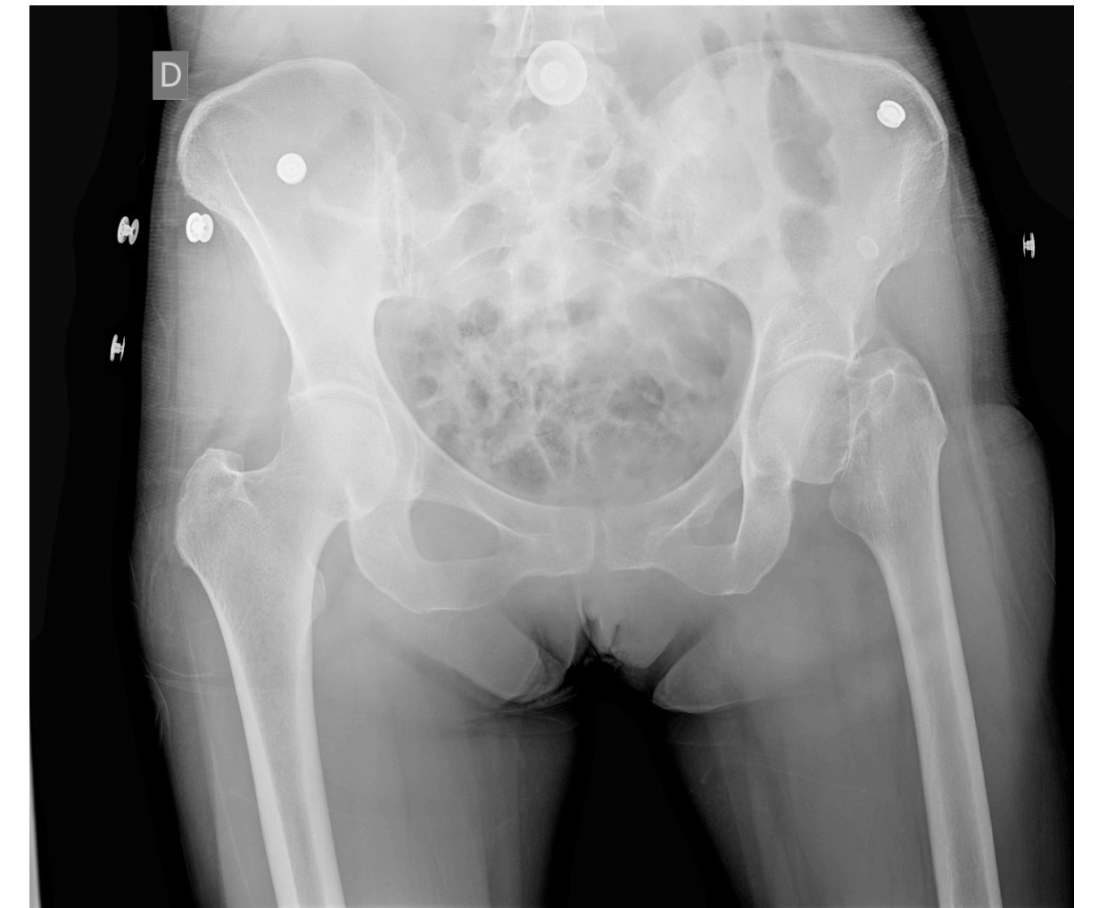
Fig 1. Fractura subcapital cadera izquierda