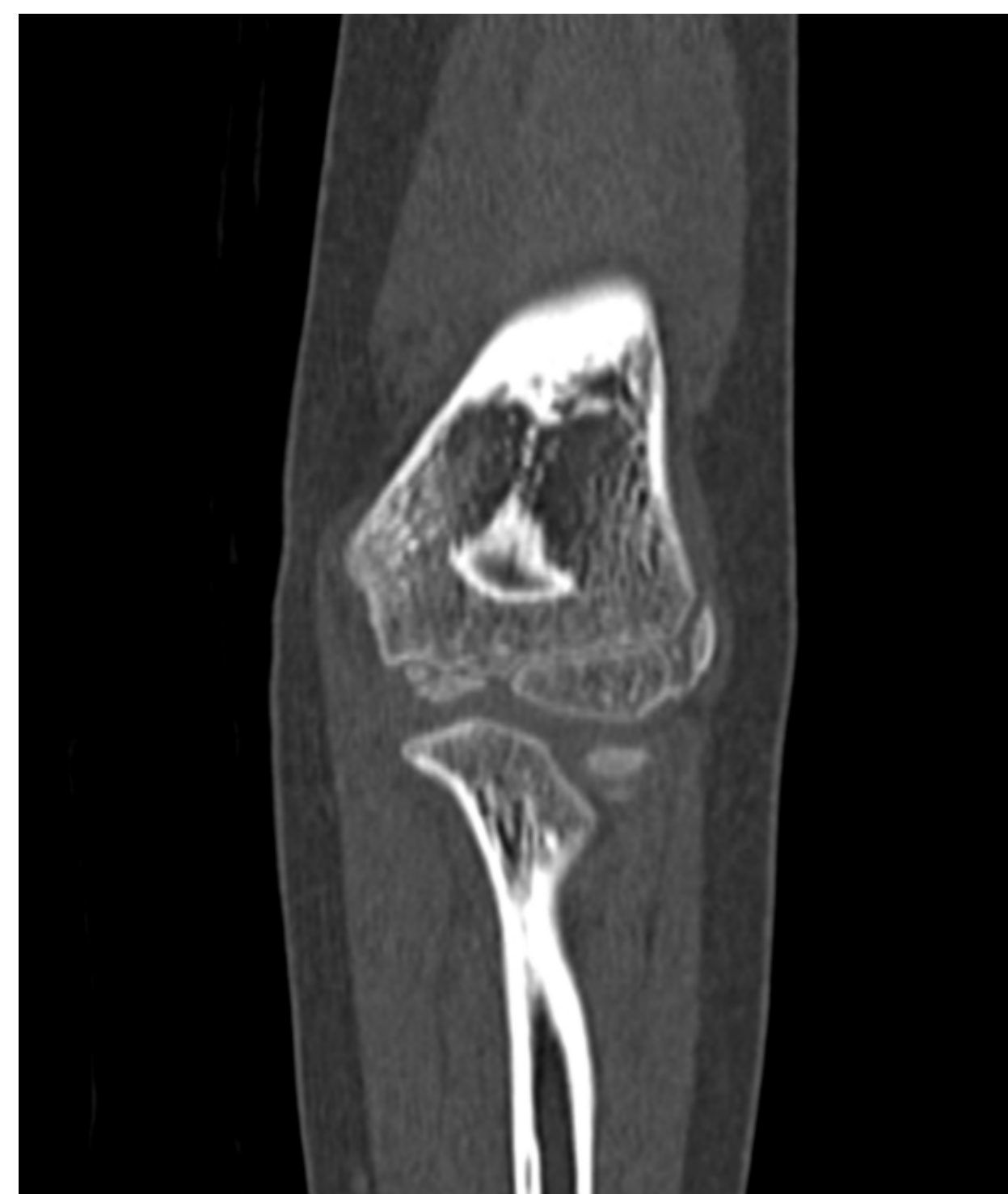
Figura 3. TC codo derecho.