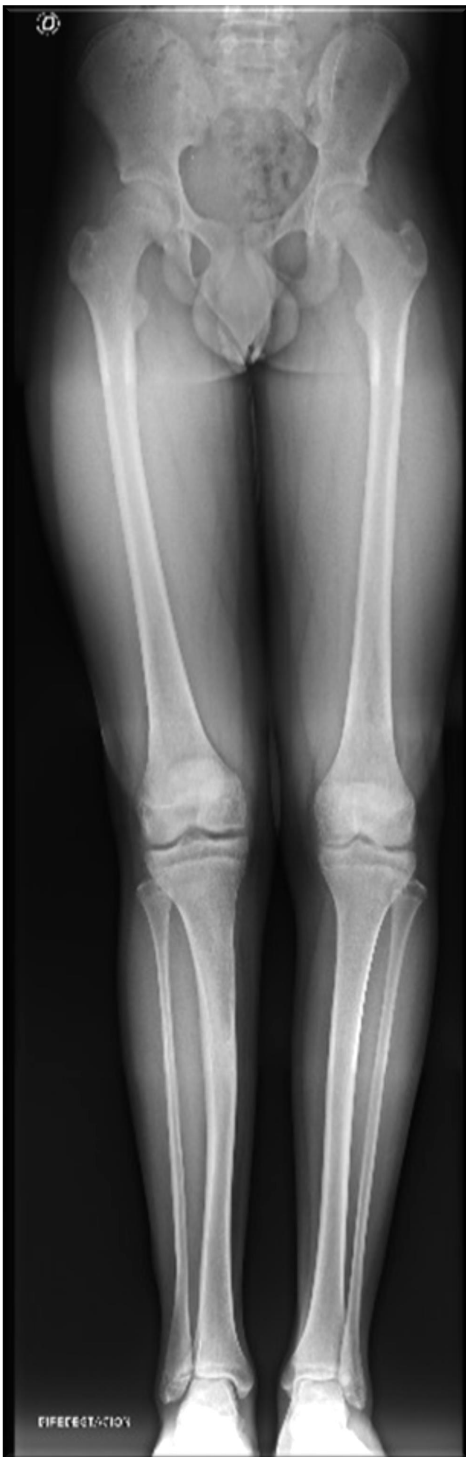
13 años postcirugía: ALTA.