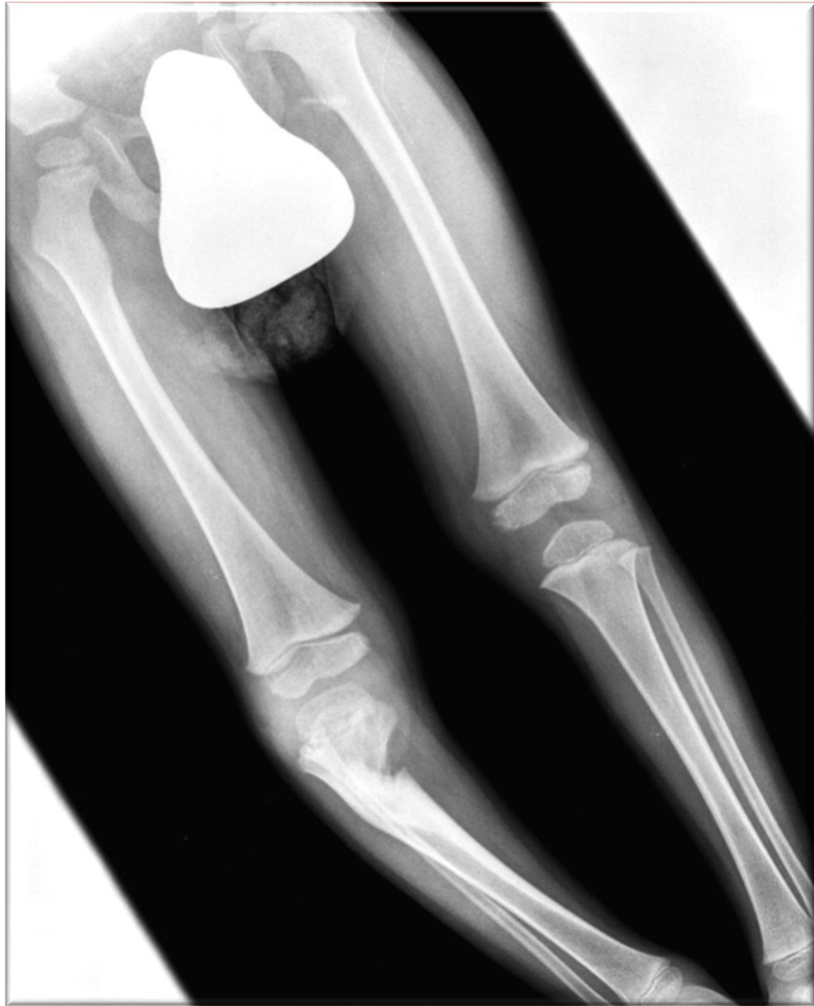
(1): Diagnóstico a los 18 meses.