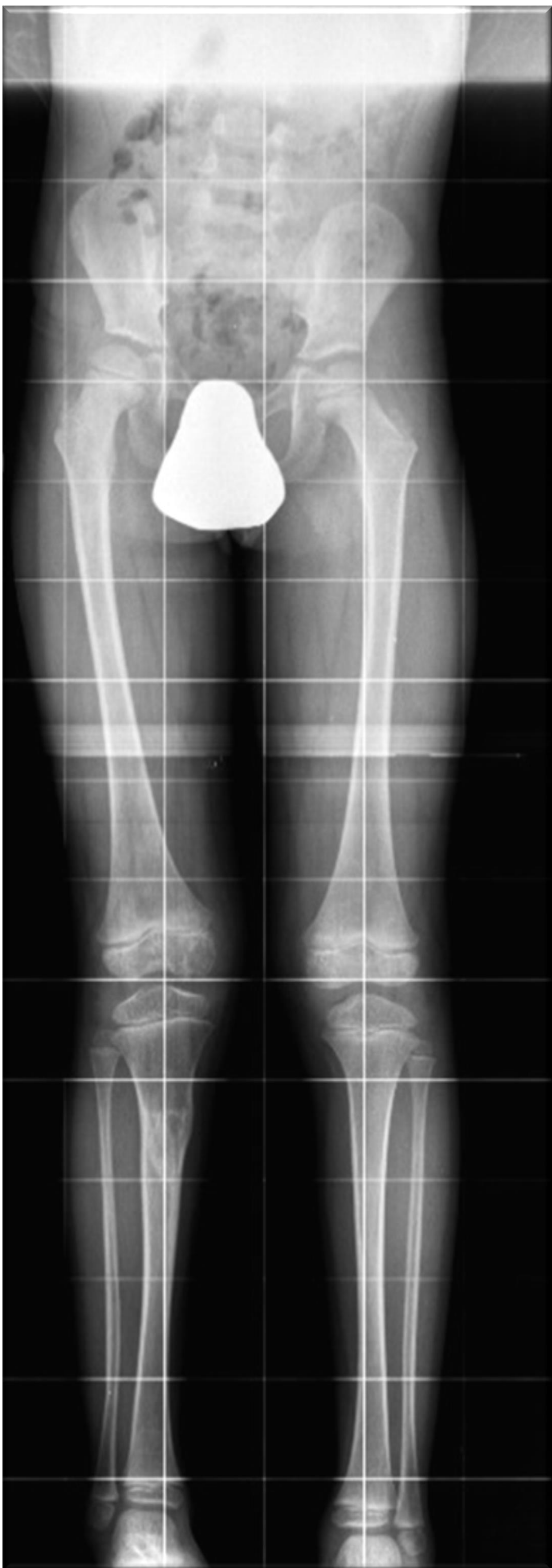
Control radiológico: 2 años postcirugía