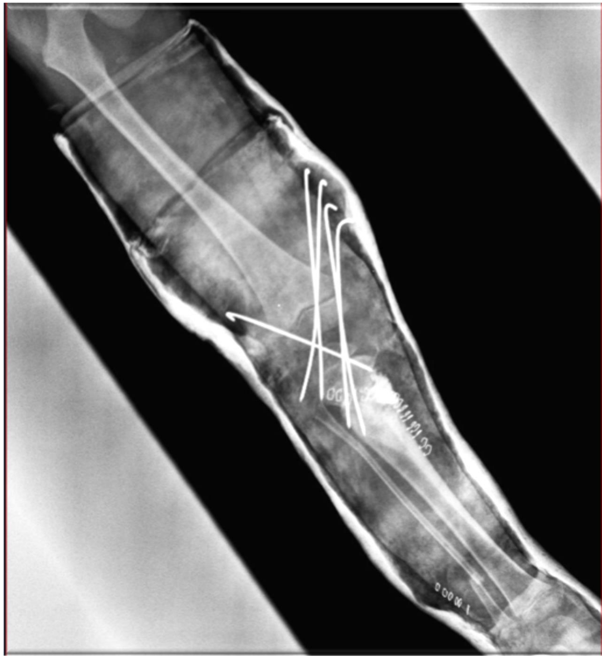
(3): Control radiológico postoperatorio.